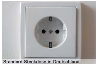
Standard-Steckdose in Deutschland